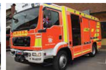
Gasilski avto, 2016