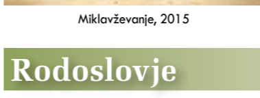
Oblacilna dediščina ...