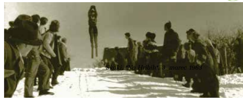
Skoki "Na hribih", 3. marec 1963