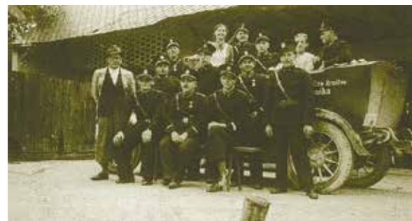
Gasilski avto iz leta 1938

Gasilsko društvo je bilo ustanovljeno leta 1908 in je v kraju ves čas zelo dejavno. Osnovna dejavnost PGD Stara Vrhnika je gašenje požarov in reševanje ob naravnih in drugih nesrečah. Posebnost društva je tehnično reševanje in nudenje prve pomoči. Leta 2001 je Gasilsko društvo Stara Vrhnika za svoje delo prejelo bronasti znak Civilne zaščite Slovenije. Leta 2008 je praznovalo 100-letnico delovanja in prejelo občinsko priznanje bronasto plaketo Ivana Cankarja in srebrni znak Civilne zaščite Slovenije, v letu 2015 pa je prejelo srebrno plaketo Ivana Cankarja za nesebično pomoč ob naravnih in drugih nesrečah.