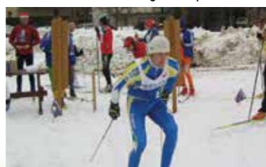
Tek na smučeh