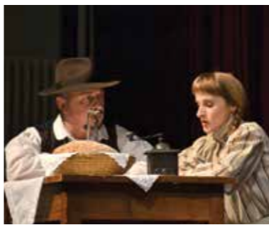
Dramska sekcija, Vrhnika 2013