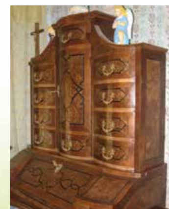
Franc Potrebuješ, stilno pohištvo