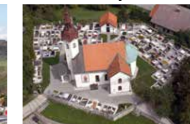
Cerkev Sv. Lenarta

Pokopališče Stara Vrhnika je last župnije Vrhnika in v upravljanju Krajevne skupnosti Stara Vrhnika. Na njem je trenutno 125 grobnih prostorov.