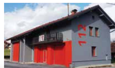
Obnovljeni gasilski dom, 2015

https://www.facebook.com/GasilciStaraVrhnika/