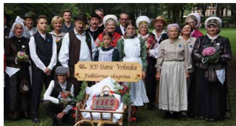
KD Stara Vrhnika, Folklorna skupina, Beljak 2015

Kulturno društvo Stara Vrhnika je bilo ustanovljeno 16. maja 2003 in je najmlajše med društvi. Člani delujejo v različnih skupinah: skupina za ohranjanje kulturne dediščine (miklavževanje, rodoslovje, krajevna zgodovina, etnologija, oblačilna dediščina), plesna skupina Vesoljski "povžki", glasbena skupina (Starovrhniški pritrkovalci), gledališka skupina, literarna skupina in likovna skupina. Društvo je ob praznovanju 10. obletnice prejelo jubilejno priznanje območne izpostave JSKD Vrhnika, Vesoljski povžki pa so prejeli posebno priznanje za desetletno delovanje na področju plesa. S svojim delovanjem je kulturno društvo prisotno tudi izven meja Slovenije, še posebno radi prikažejo starovrhniške male zvonove in oblačilno dediščino naše vasi iz 19. stoletja na srečanju narodnih noš v Beljaku; povabljeni pa so bili tudi v München.