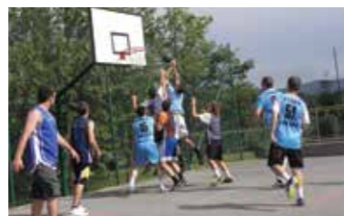
Košarka treh generacij