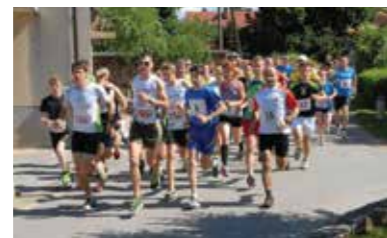
Tek "Star Maln"