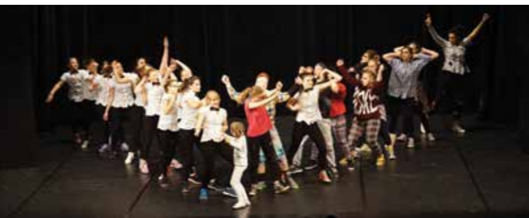
Plesna skupina Vesoljski povžki, 2016

Kulturno društvo Stara Vrhnika je bilo ustanovljeno 16. maja 2003 in je najmlajše med društvi. Člani delujejo v različnih skupinah: skupina za ohranjanje kulturne dediščine (miklavževanje, rodoslovje, krajevna zgodovina, etnologija, oblačilna dediščina), plesna skupina Vesoljski "povžki", glasbena skupina (Starovrhniški pritrkovalci), gledališka skupina, literarna skupina in likovna skupina. Društvo je ob praznovanju 10. obletnice prejelo jubilejno priznanje območne izpostave JSKD Vrhnika, Vesoljski povžki pa so prejeli posebno priznanje za desetletno delovanje na področju plesa. S svojim delovanjem je kulturno društvo prisotno tudi izven meja Slovenije, še posebno radi prikažejo starovrhniške male zvonove in oblačilno dediščino naše vasi iz 19. stoletja na srečanju narodnih noš v Beljaku; povabljeni pa so bili tudi v München.