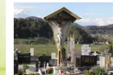
Pokopališče Stara Vrhnika