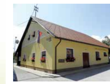
Dom KS Stara Vrhnika

Dom KS so leta 1953 zgradili vaščani. Leta 1991 so ga dozidali s športnimi prostori, v obdobju 2006-2012 pa z novo večnamensko dvorano. Zraven doma je postavljeno in urejeno otroško košarkaško in balinarsko igrišče. Pred domom je urejeno tudi asfaltno parkirišče. Vaščani so s prostovoljnimi delom in finančno pomočjo veliko pripomogli k današnjemu izgledu doma.