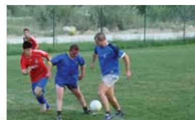
Nogomet treh generacij